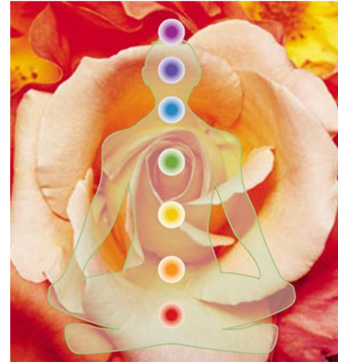
7 Energie-Zentren (Chakren)